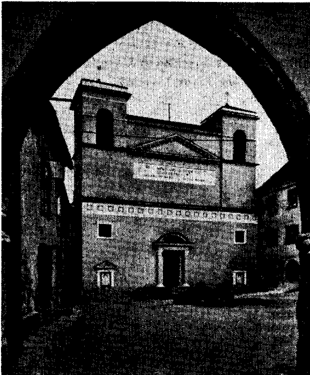
Peetri ja Pauli kirik Tallinnas